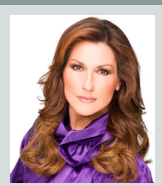
Συντονισμός: Ειρήνη Νικολοπούλου (Δημοσιογράφος - Επικοινωνιολόγος)